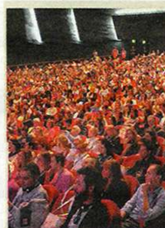
TEDX 2017 al Comunale

“From me to we” è il tema guida della quarta edizione del Ted X a Vicenza che andrà in scena al Teatro Comunale il prossimo 9 giugno. Il Ted “original”, quello statunitense, concede ai team locali di creare un proprio evento, purché rispetti i canoni: presentare idee innovative che puntino a migliorare il mondo. I team scelgono gli speaker - innovatori con tutte le carte in regola - e li seguono in un percorso di formazione, perché non è semplice condensare il proprio messaggio in 18 minuti.